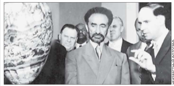
В музее Хайле Селассие I уделил внимание образцам яшмы и родонита, но особенно его заинтересовал истинно уральский камень — малахит