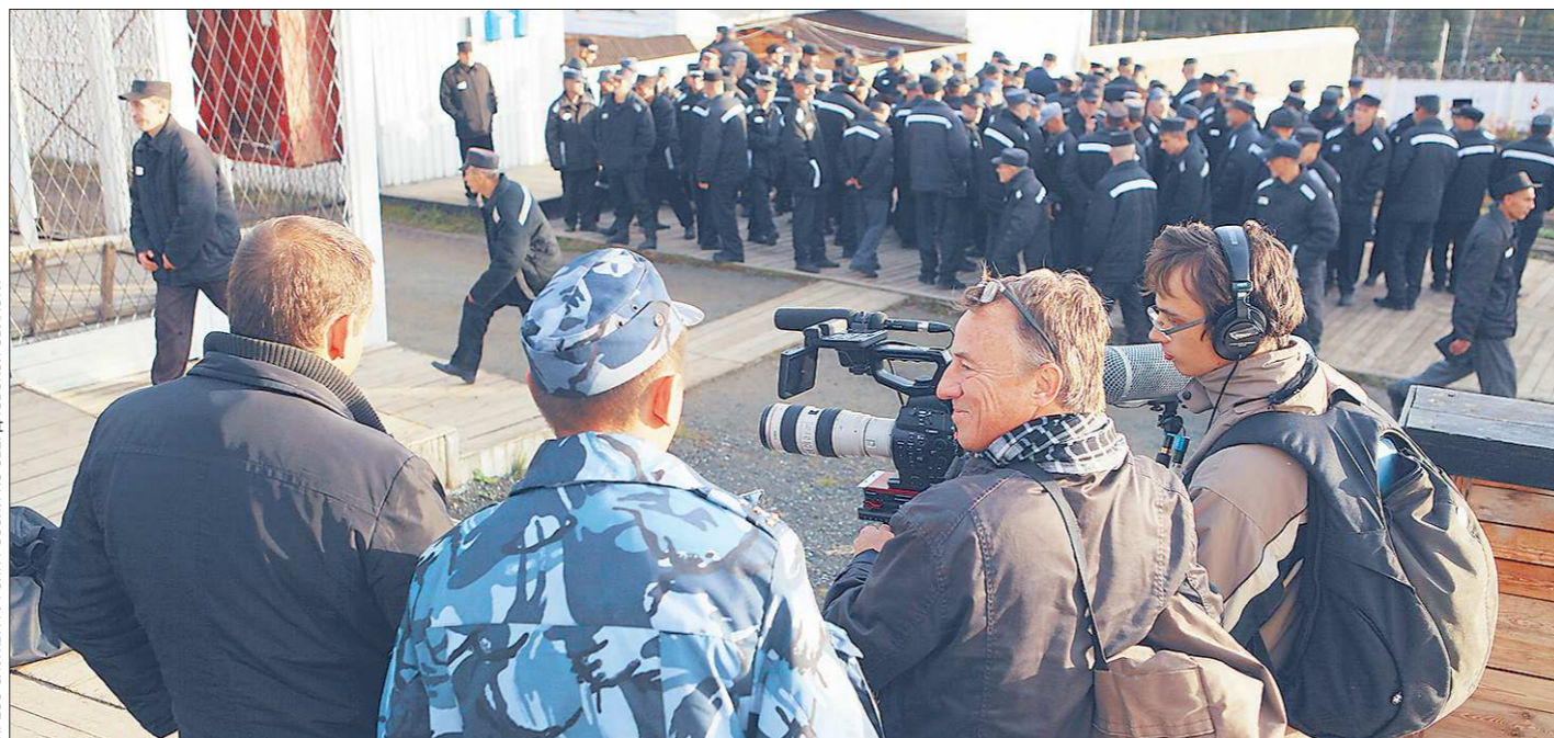
ПРЕСС-СЛУЖБА ГОСУДАРСТВА ПО СВЕРДЛОВСКОЙ ОБЛАСТИ