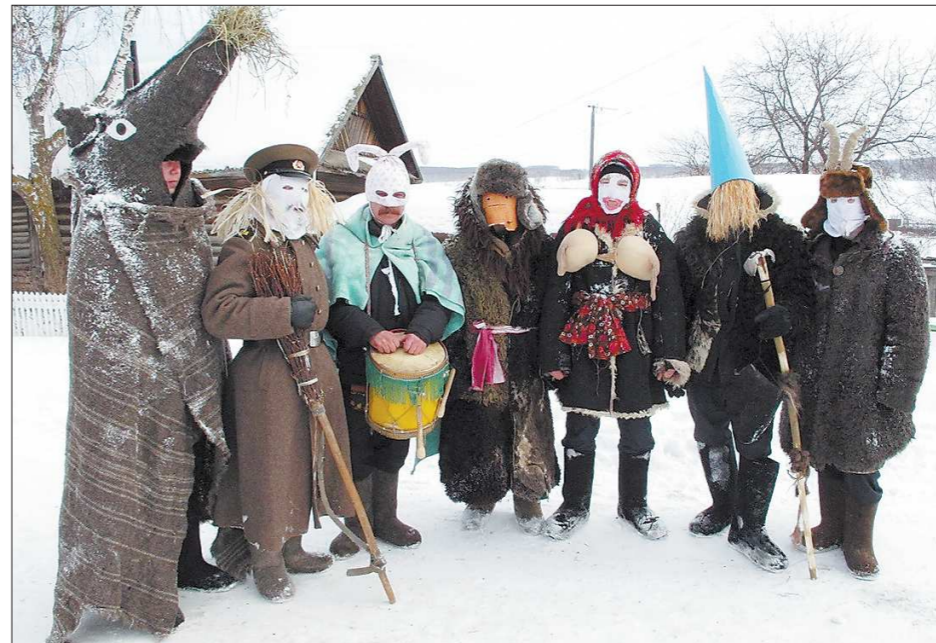
Новый год марийцы встречают в костюмах, отпугивая злых духов и призывая добрых защищать семью