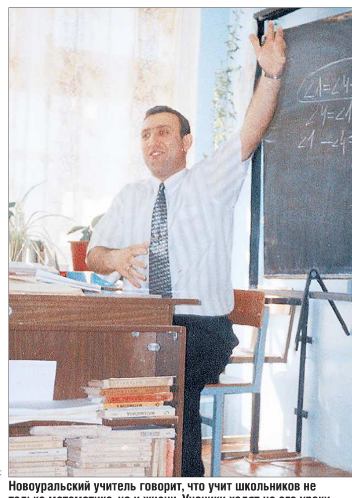
Новоуральский учитель говорит, что учит школьников не только математике, но и жизни. Ученики ходят на его уроки с удовольствием и обожают своего математика за чувство юмора и жизнелюбие