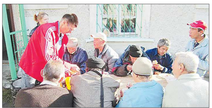
В последнее время на обед в этот центр приходят и малообеспеченные ревдинцы

Это не к столу, конечно, будет сказано. Но, с другой стороны, разговоры под благотворительные пельмени вряд ли ведутся о высоких материях. Скорее всего, о рубашке, которая ближе к телу.