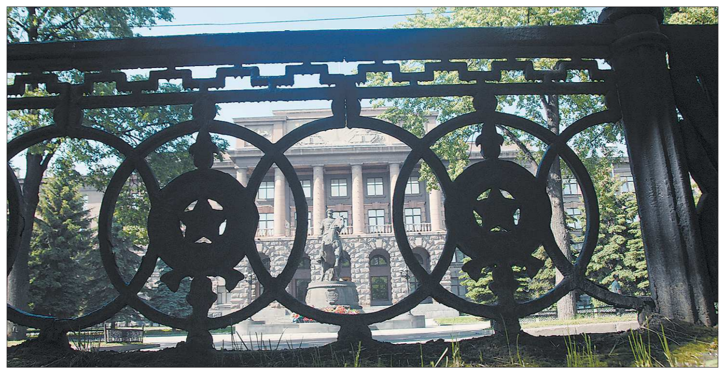
Декоративные ограждения во многом дополняют архитектурную красоту здания штаба Центрального военного округа