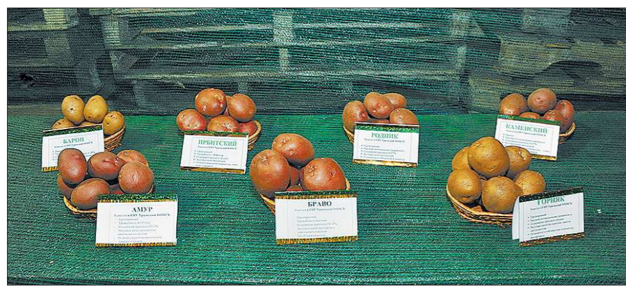
Помимо сортов Барон, Каменский, Ирбитский, предназначенных для возделывания на личных подсобных участках, в арсенале уральских селекционеров есть сорта и для комбайновой уборки — Горняк, Амур, Браво