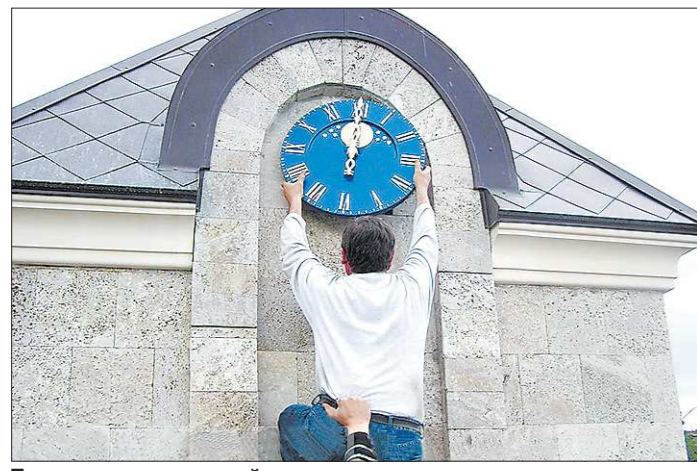
Повременить с уплатой налогов – значит оставить деньги в обороте компании и направить их на свои новые производства