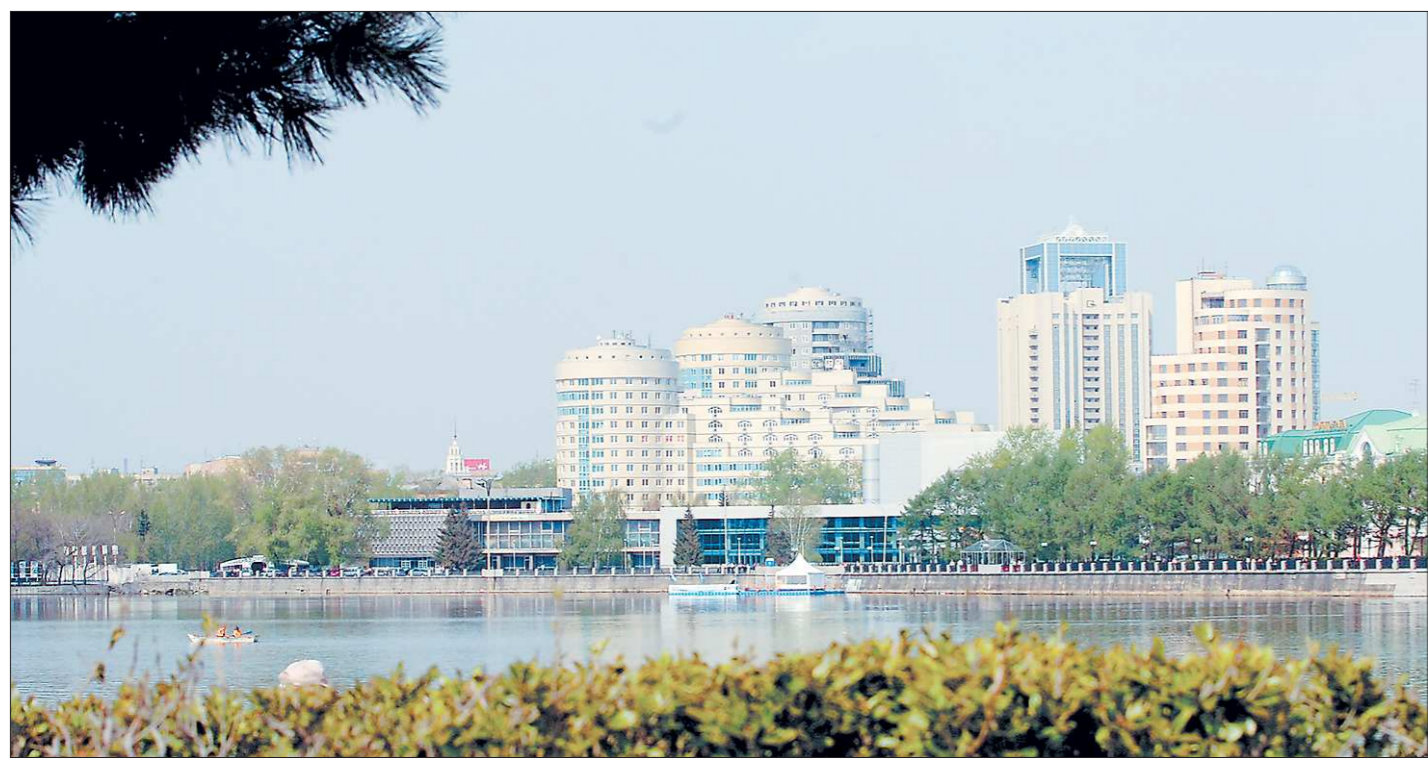
Город может выбрать принцип устойчивого развития или пойти по пути увеличения численности населения