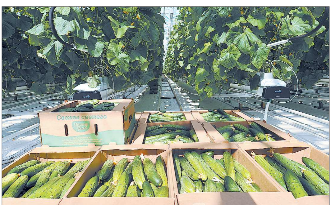
Благодаря современным технологиям обильный урожай можно собирать круглый год