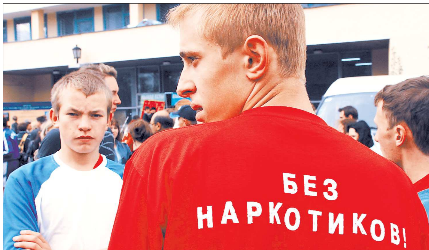
А тем, кто ведёт здоровый образ жизни, наркотики не страшны