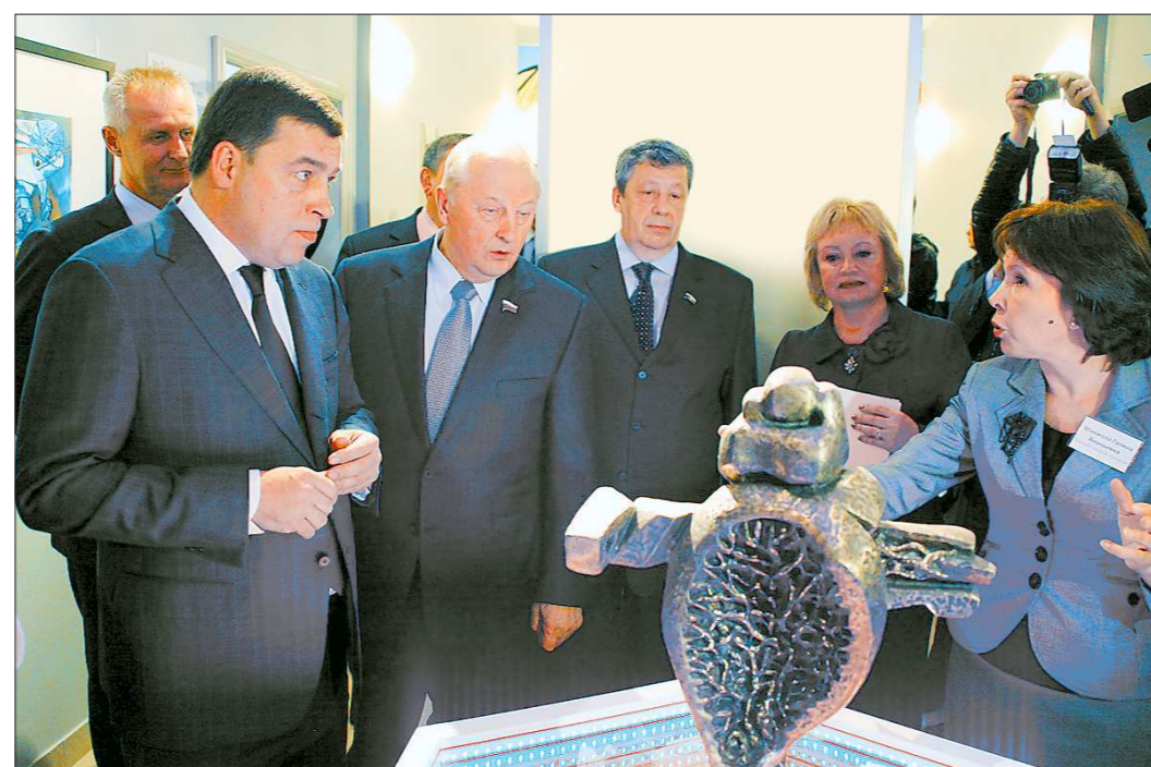
Губернатор привлёк к сотрудничеству в продвижении знаковых для региона проектов таких политических «тяжеловесов», как Эдуард Россель и Аркадий Чернецкий

Интересна эволюция деятельности и позиции Куйвашева в пиар-пространстве: довольно быстро он ушёл от образа «пряничного» губернатора (который должен нравиться всем) к имиджу регионального лидера, наступающего продвигаящего интересы области на федеральном и международном уровнях. Этого требует и время, и особое положение Екатеринбурга, который сейчас выдвинулся на «острие атаки»