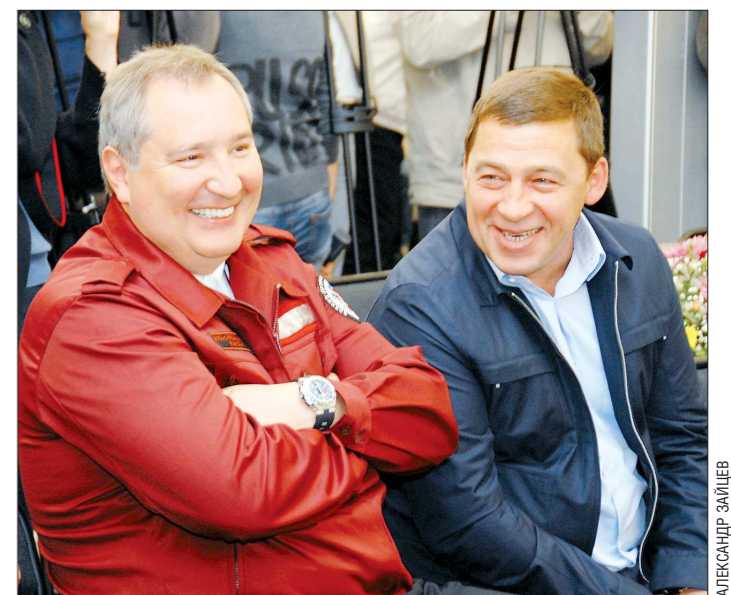
Выставки военной техники, ежегодно проходящие в Нижнем Тагиле — один из известных брендов Среднего Урала: вице-премьер правительства РФ Дмитрий Рогозин (слева) и губернатор Евгений Куйвашев наблюдают за демонстрацией современного оружия на полигоне «Старатель»