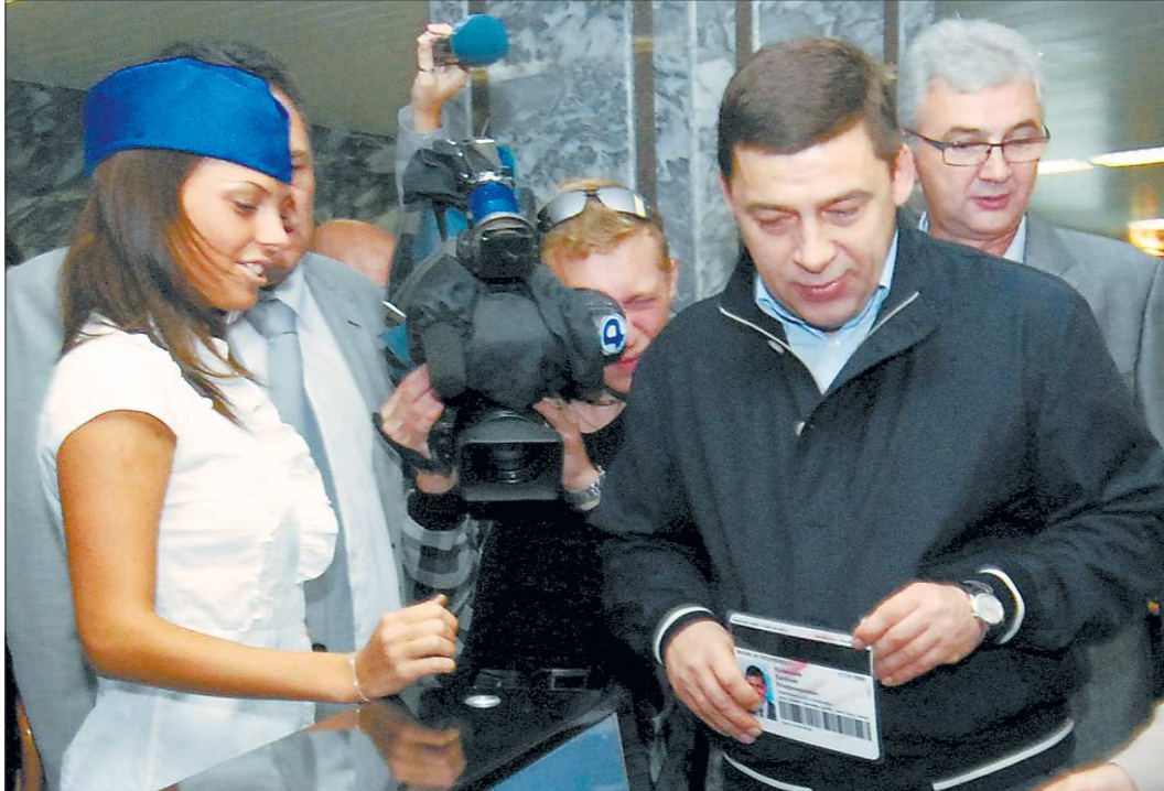
Глава региона запускает новую станцию «Чкаловская», которой завершилось строительство первой линии метро в Екатеринбурге