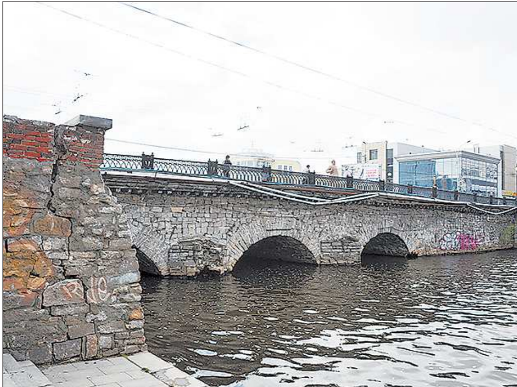
Под этим мостом на улице Малышева собираются прокладывать пешеходные дорожки. Есть надежда, что изменения затронут и непосредственно мост, рассыпающийся на глазах