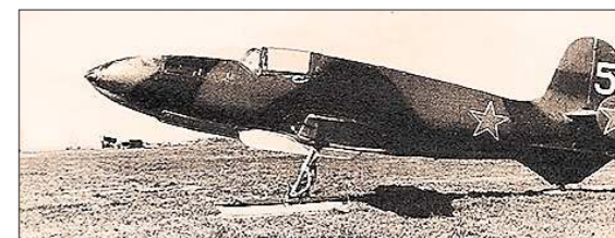
До нашего дня ни один самолёт БИ-1 не уцелел

15 мая 1942 года с аэродрома Кольцово в небо поднялся первый отечественный реактивный самолёт. Это был истребитель БИ-1, за штурвалом которого находился лётчик-испытатель Григорий Бахчиванджи. Разработка этого самолёта началась в 1941 году в Подмоскowie, однако уже в ноябре того же года производство было перебазировано в Свердловскую область — в посёлок Билимбай. В марте 1943 года во время седьмого испытательного полёта Бахчиванджи погиб (теперь в Екатеринбурге есть улица, названная именем пилота). Эта катастрофа привела к отмене производства БИ-1, которых к