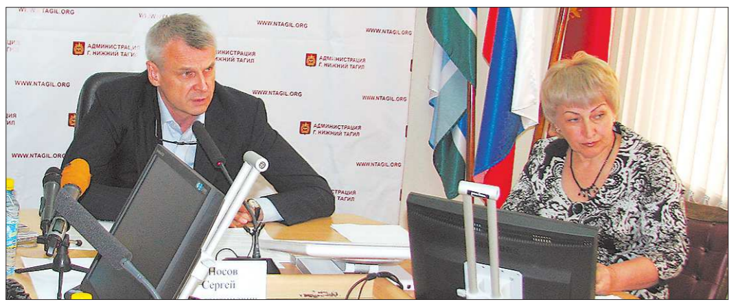
Этим летом тагильчане будут не только много строить, но и сносить