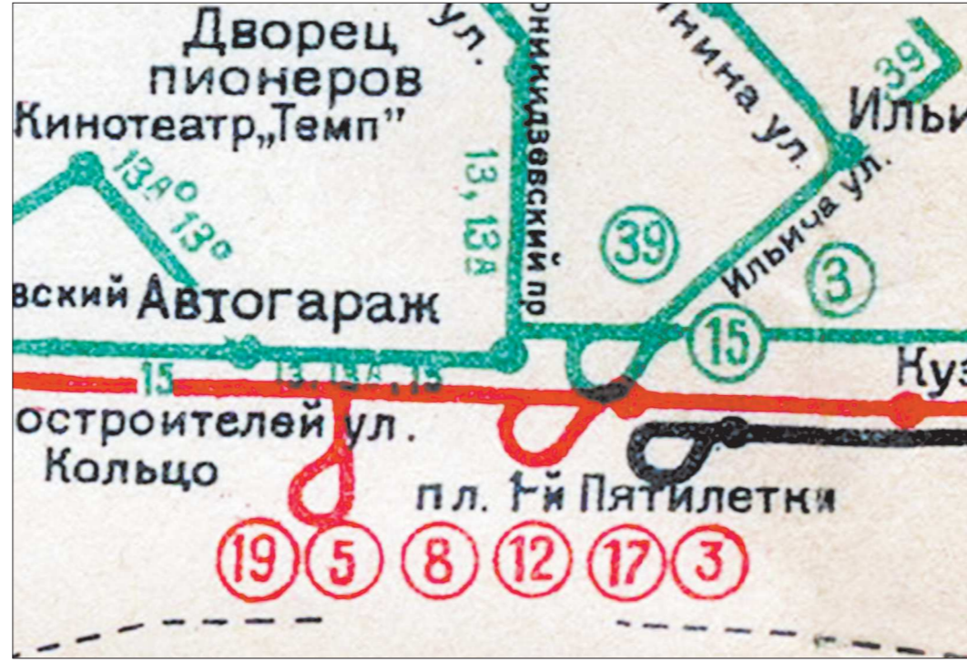
Это – фрагмент схемы маршрутов свердловского городского транспорта 1963 года. Красным цветом показаны трамвайные линии. Соединительная ветка между двумя кольцами присутствует

Ветка на ВИЗ будет полутракторной, это уже посерьёзнее, чем на Уралмаше. Мож-