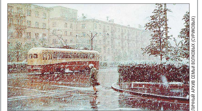
Май 1965 года. Снегопад на проспекте Ленина — перекрёсток с улицей Тимирязева