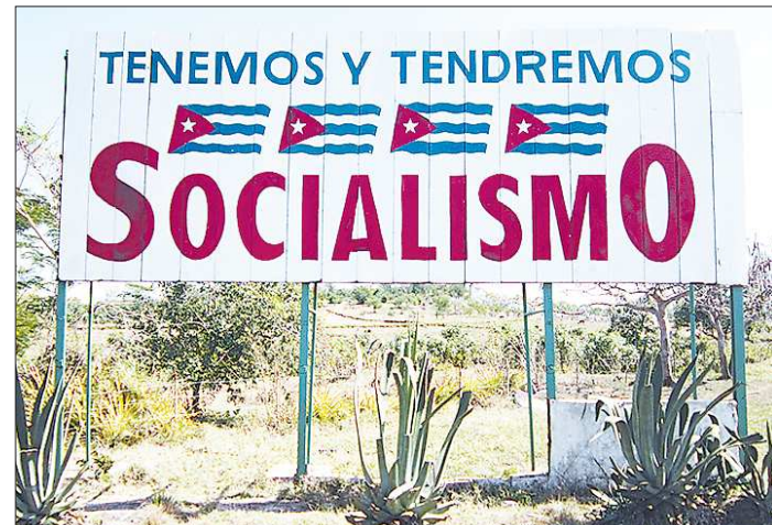
Лозунг у въезда в родную деревню Фиделя Кастро гласит: «У нас был и будет социализм»

нённые Штаты в своих многочисленных речах и интервью – «северная империя». В отношении Советского Союза подобные определения не звучали никогда. Однако интеллект Фиделя Кастро, конечно же, понимал, что советскую внешнеполитическую диктует не только абстрактный пролетарский интернационализм.