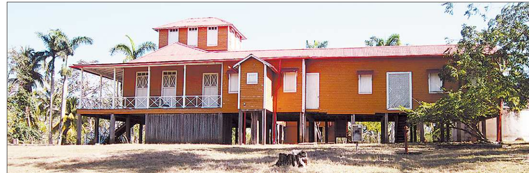
Это здание в Биране – копия того, в котором 13 августа 1926 года родился Фидель Кастро (строение сгорело в 1954 году). Говорят, увидев новодель, вождем кубинской революции поразился тому, насколько точно воспроизведён его отчий дом

...Термин, которым кубинский лидер награждал Соеди-