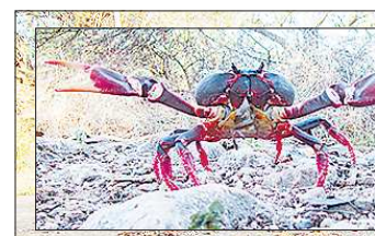
Эта экологическая катастрофа повторяется каждую весну: шоссе из Тринидада в Сьенфуэгос усеяно тысячами раздавленных крабов

Либеральный реформатор Михаил Горбачёв, коммунистический диктатор Николае Чаушеску, пламенные революционеры братья Кастро... Все эти столь разные политические режимы объединяет одно: невероятные усилия, которые должны прилагать простые люди, чтобы обеспечить себя и свою семью элементарными вещами.