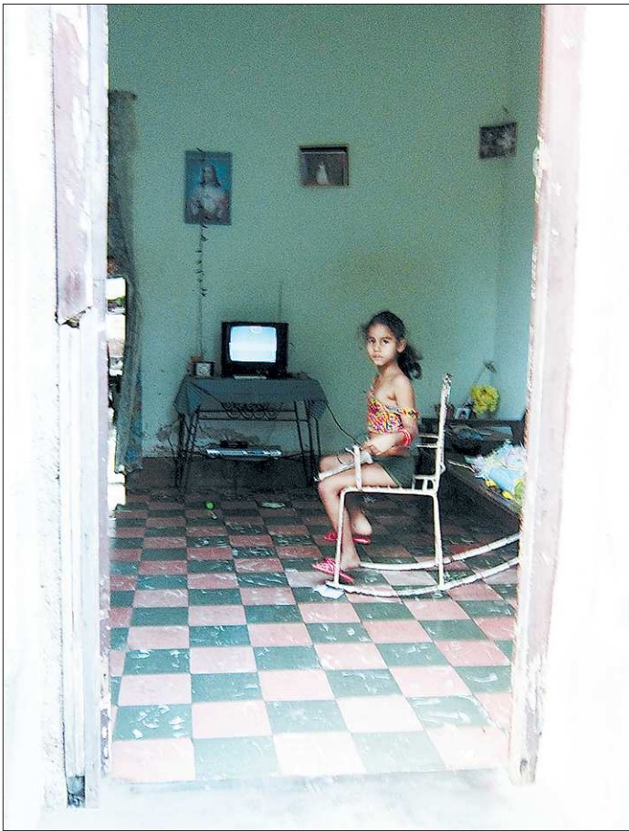
Жители кубинской провинции не имеют привычки закрывать двери своих домов. И, как правило, взору туристов предстают весьма скромные интерьеры