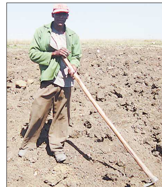
Раньше эта земля принадлежала отцу Фиделя. Теперь всем тут управляет государство. Но не похоже, чтобы это сильно облегчило труд крестьян

Но люди приходят в этот мир совсем не для того, чтобы давиться в очередях за колбасой (как в позднем СССР), или, получив по карточке десяток яиц в месяц, за остальные платить в 15 раз дороже (именно так происходит на Кубе).