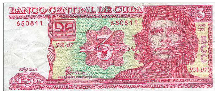
На одной купюре достоинством в три песо – портрет Че Гевары. На другой, с таким же номиналом, – памятник Че Геваре, возвышающийся над его мавзолеем в городе Санта-Клара. Одним деньгами кубинское государство расплачивается со своими гражданами, другими (так называемыми «куками») обеспечивает иностранных туристов в обмен на доллары и евро. Покупательная способность конвертируемых банкнот (справа) в 25 раз выше, чем у «деревянных», а выбор товаров в валютных магазинах на порядок лучше, чем в обычных

«Бедный исландец без гроша в кармане едет на Кубу в поисках лучшей жизни. Претерпя массу лишений, работая с утра до ночи, он упорно строит свою тростниковую империю на западе острова. К концу жизни площадь его латифундии достигает одиннадцати тысяч (!) гектаров. «Высочка» из провинции Ориенте, само собой, вызывает смешанные чувства, но дружбу с ним не считает зазорной сам архиепископ Кубы».