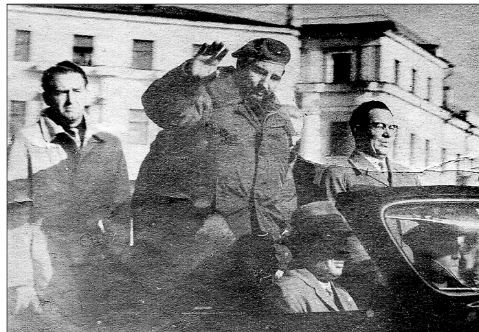
Этот любительский снимок сделан 13 мая 1963 года в Свердловске на перекрёстке Сибирского тракта и улицы Восточной