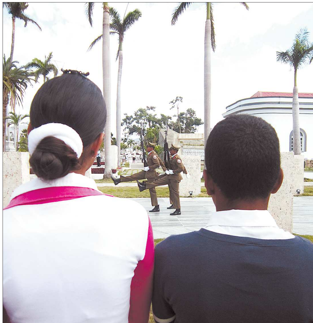
На могиле национального героя Кубы Хосе Марти в городе Сантьяго-де-Куба смена почётного караула происходит каждые полчаса

Российский турист в кубинской глубинке – большая экзотика. В Санта-Кларе, Камагуэе, Тринидаде полным-полно групп из Канады и Германии, но почти