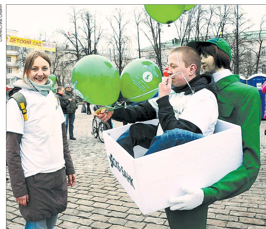
На первомайской демонстрации свердловчане поддержали предложение о закладке в Екатеринбурге Аллеи Труда