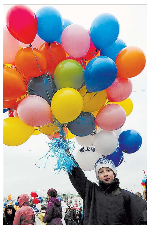
Традиционная черта нашего Первомая – многоцветье отпускаемых в поднебесье воздушных шаров