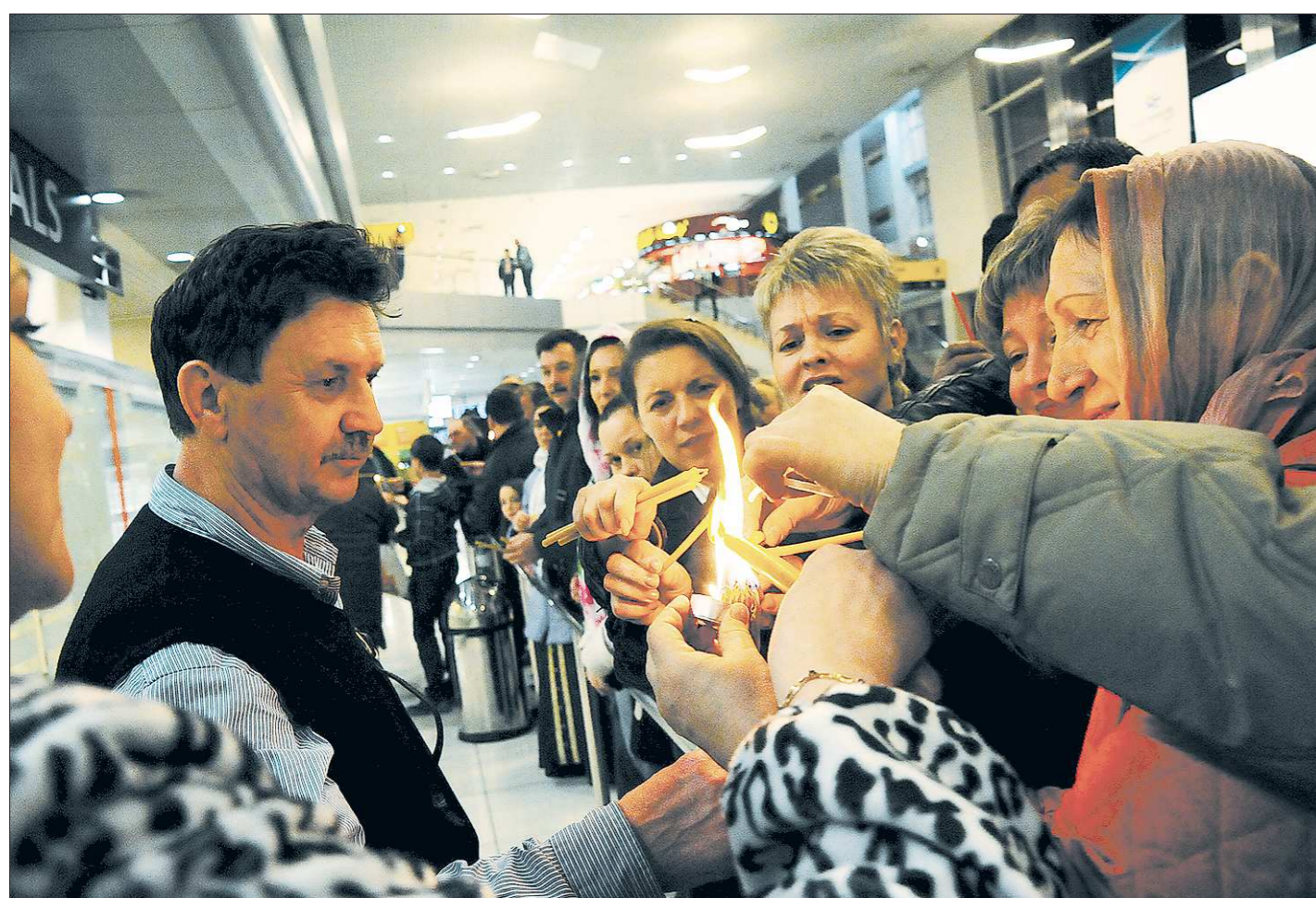
В Великую субботу в екатеринбургском Свято-Троицком кафедральном соборе прошли праздничные богослужения