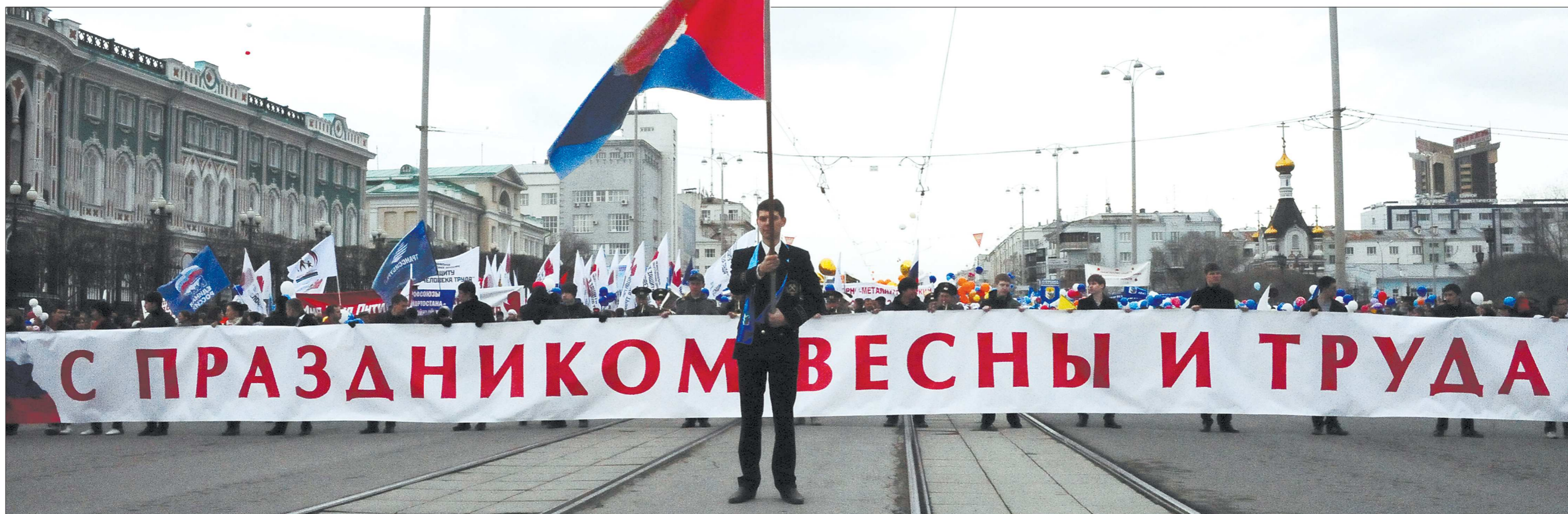
«Мир, Труд, Май» – не одно поколение россиян выросло с этими словами, и уже трудно представить себе этот день без таких вот масштабных торжеств...