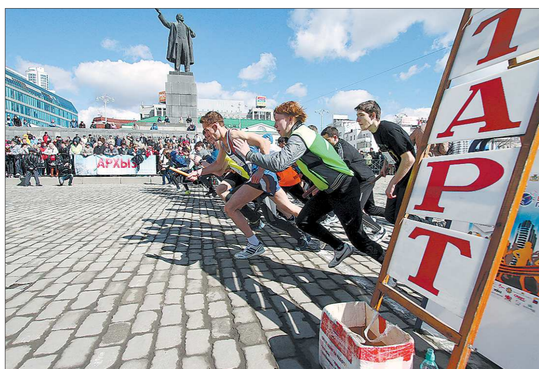
Эстафета «Весна Победы» пронеслась по главному проспекту уральской столицы уже в 77-й раз, перерыва не было даже в годы Великой Отечественной войны. В этом году старт на площади 1905 года приняли более 250 команд; по наклейкам на автобусах, привезших участников, можно было изучать географию Свердловской области. И легкоатлеты из небольших городов составили нешуточную конкуренцию представителям Екатеринбурга. Так, асбестовцы из школы № 4 победили в зачёте среди образовательных учреждений, а их старшие коллеги стали третьими в забеге сборных городов и районов. Ребята из Каменска-Уральского завоевали серебро среди школьников и бронзу в споре ДЮСШ. Есть награды и у тагильчан