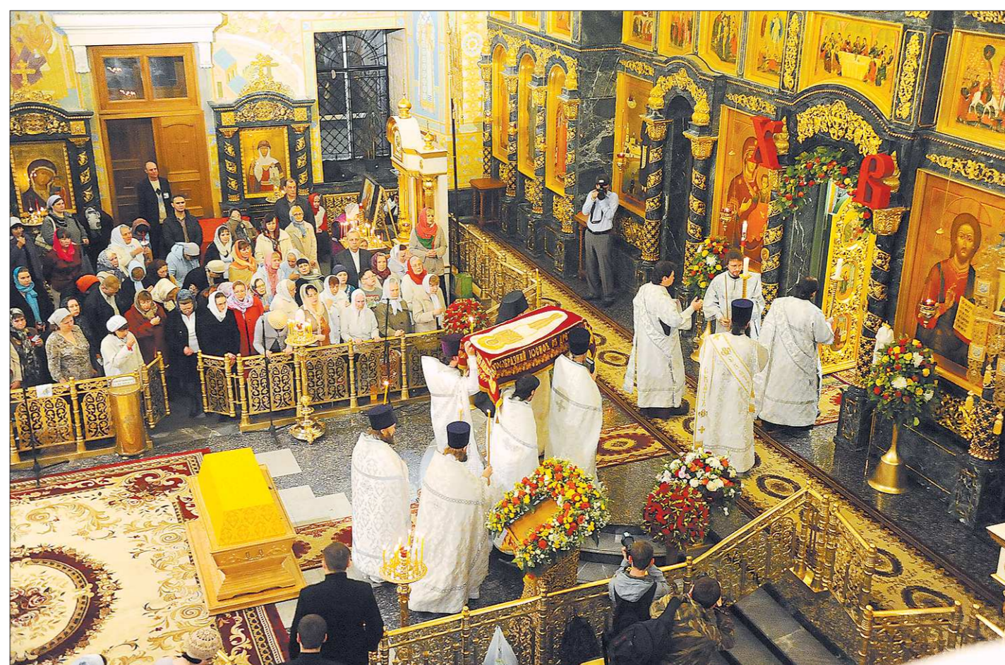
В пасхальную ночь в столицу Урала привезли благодатный огонь. Лампаду доставили на борту самолёта прямо из Иерусалима – нерукотворный огонь сопровождал митрополит Екатеринбургский и Верхотурский Кирилл