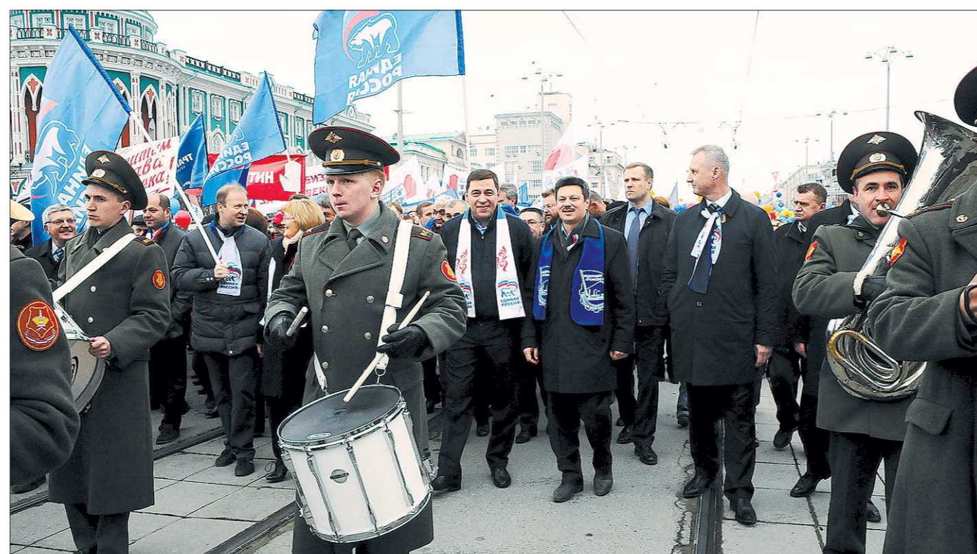
Праздничную колонну возглавили руководители области, лидеры профсоюзов, активисты Общероссийского народного фронта