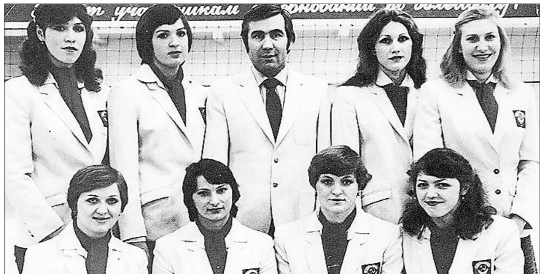
Сборная СССР – чемпион Олимпиады 1980 года

Волейбольный зал славы, расположенный в американской Халкиоке, считающейся родиной волейбола, я помню первый вопрос, который у меня возник: «А что, разве Карполь до сих пор там не был?». Возможно, также считали и идеологи этого проекта, а когда спросили, быстро исправили свою оплошность.