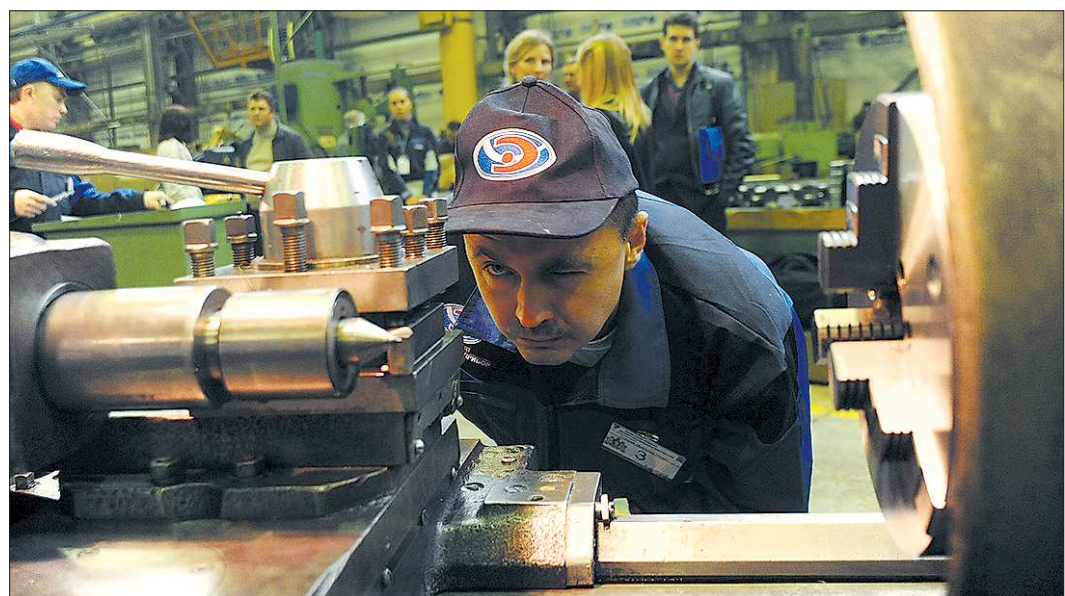
Если бы в России всего лишь 10 процентов работников давали тот же уровень производительности труда, что и в США, российский ВВП вырос бы в полтора раза