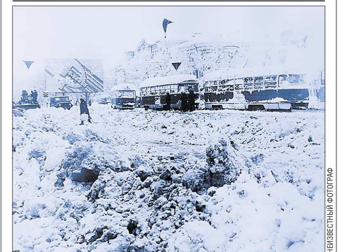
Свердловск. 2 мая 1984 года

В 1984 году на Свердловскую область обрушился необычайно сильный снегопад.