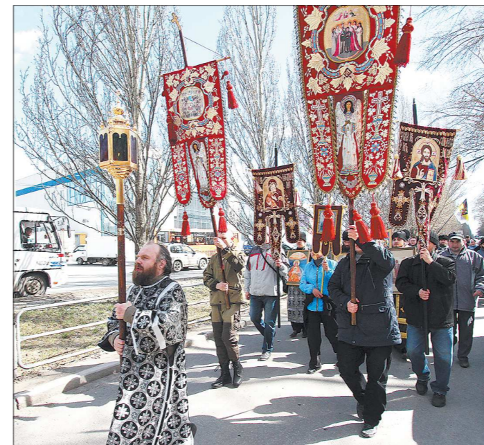
Крестоходцы проделали по городу путь в несколько километров

Маршрут крестного хода повторил путь, по которому следовали Романовы (приведены современные названия): железнодорожная станция Шарташ, улица Куйбышева, затем Восточная, Челюскинцев, вокзал, Свердлов, Карла Либкнехта, Храма-Крови. По пути верующие