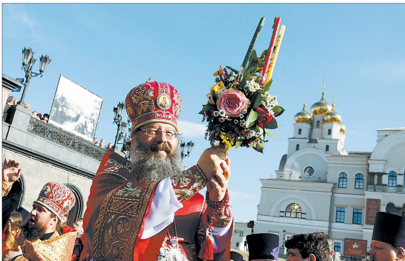
Прошлогондья Пасха стала первой на уральской земле для митрополита Екатеринбургского и Верхотурского Кирилла