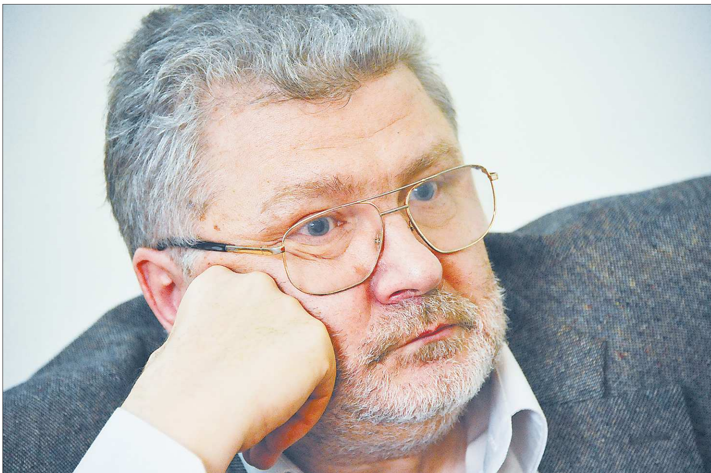
В 1990 году повесть Полякова «Сто дней до приказа», избобличившую дедовщину, заблокировали военные. Примерно в те же годы на Красной площади сел немецкий лётчик Руст. «Лучше бы вы Руста не пропустили...» – сыронизировал Поляков

Такого больше и не было. Но за десять «либеральных лет», когда к тому же читатели объективно разошлись от нескольких десятков центральных газет и журналов к нескольким сотням новых, которые появились, «ЛГ» и потеряла подписчиков в регионах: читать в обнищавших уральских или сибирских городах либеральный густопсовый вздор было отвратительно. Тираж упал до 20 тысяч.