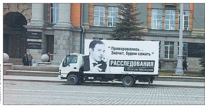
Фургон простоял у мэрии весь день. Никто из чиновников к нему не подошёл

жение автобусов. Аргументы специалистов сводятся к тому, что злосчастный ремонт здесь делать бесполезно — через неделю залатанные наспех колдобины проявятся вновь. И предлагают вставить этот участок в план капремонта на 2014 год. При этом оценивают стоимость работ в 3,5 миллиона рублей. Оперативно изыскать такие средства сейчас уже невозможно. Напомним, что ровно год назад в Ревде по той же причине на два месяца был закрыт автобусный маршрут между городом и посёлком ЖБИ.