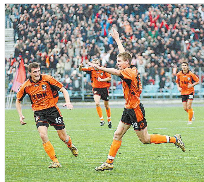
Редкие матчи «шмелей» с клубами элиты неизменно собирали аншлаги – победный гол в кубковой игре с «Сатурном» 17 сентября 2007 года