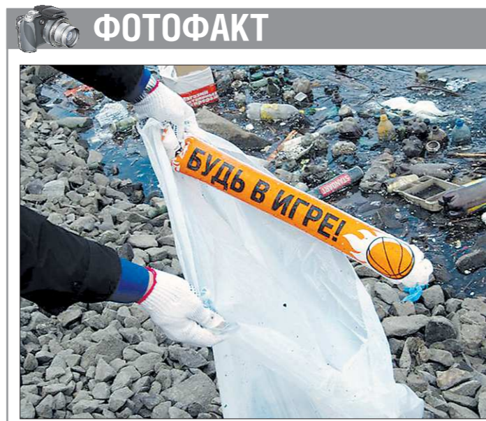
ФОТОФАКТ Во вторник молодёжное правительство Свердловской области вышло на уборку берегов Исети. На подвиги играющую в министров молодёжь сподвигло удручающее состояние дна, о котором так много говорили средства массовой информации на прошлой неделе. Собрав в обеденный перерыв восемь мешков мусора, начинающие чиновники

Кадровый вопрос в медицинской отрасли региона действительно стоит очень остро. Об этом свидетельствуют события, произошедшие недавно в Ирбите и Красноуфимском городском округе. Читайте ниже материал «Поражение в правах Пациентов».