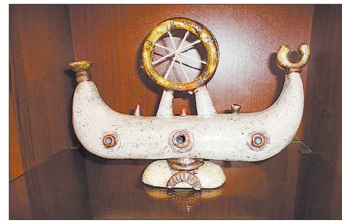
Корабль считается одним из главных символов Голландии. Кстати, корабельному делу мы научились именно у её мастеров