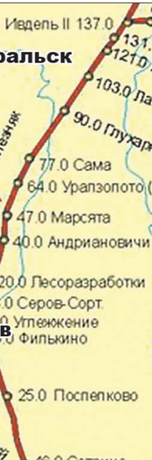
Сначала маршрут сократили до Бокситов, теперь североуральскую ветку отсекают вовсе

Областной министр транспорта Сергей Нех: «В 2013 году вместо необходимых 36,3 миллиарда рублей предусмотрено 14,8 миллиарда. В этих условиях ОАО «Федеральная пассажирская компания» планирует сокращение пассажирских поездов. В первую очередь будут отменены малодоходные, нерентабельные маршруты». В число обречённых попал и поезд «Бокситы – Екатеринбург». Железнодорожники подсчитали: в среднем на конечной точке, в Бокситах, в поезд садятся около 40 человек. На последующих станциях пассажиров прибавляется не намного больше, и лишь в Серове состав, рассчитанный на 300-400 человек, начинает наполняться. По данным Свердловской железной дороги, в прошлом году этот поезд принёс убытков на 114 миллионов рублей. Денежная чаша весов, конечно же, перетянула человеческую.