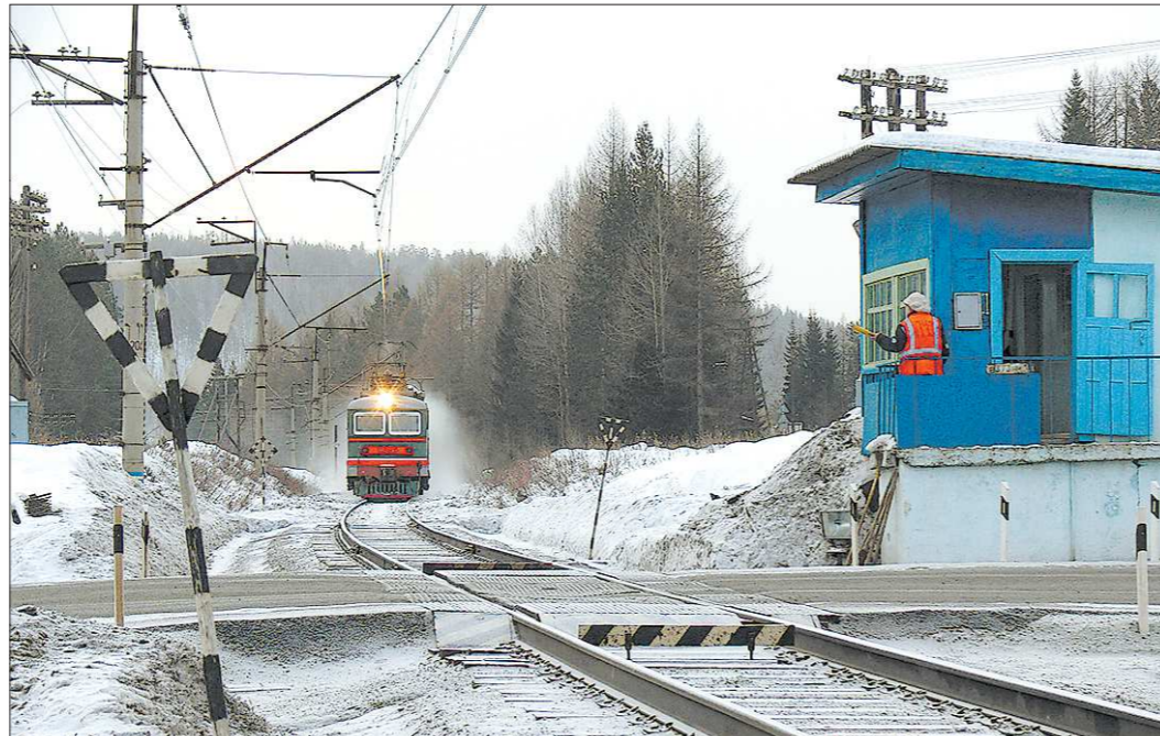
Прибывающий на станцию Бокситы пассажирский поезд скоро можно будет увидеть только на фотоснимках

Министр регионального развития РФ Игорь Слюняев, обращаясь к муниципальному сообществу страны, выразил надежду, что участие в конкурсе и победа станут дополнительными стимулами к развитию самоуправления в регионах. Полевчанам остаётся только уповать на то, что когда-нибудь и за дорожный город получит награду. А уж на благодарность жителей точно можно рассчитывать.