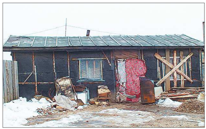
Первая десятка китайцев прибыла в Останино в начале апреля. Летом тут работает до двухсот человек. Гастарбайтеры живут в таких бараках до поздней осени, зимой здесь — никого

«безвизовиков» (в частности из Узбекистана) растёт из года в год. Теперь китайским предпринимателям проще использовать свободные руки выходцев из СНГ, а в Белоярском округе, к примеру, в овощных теплицах бок о бок с гастарбайтерами нынче работают и местные жители. В остальном без перемен: труд на земле тяжёл, усло-