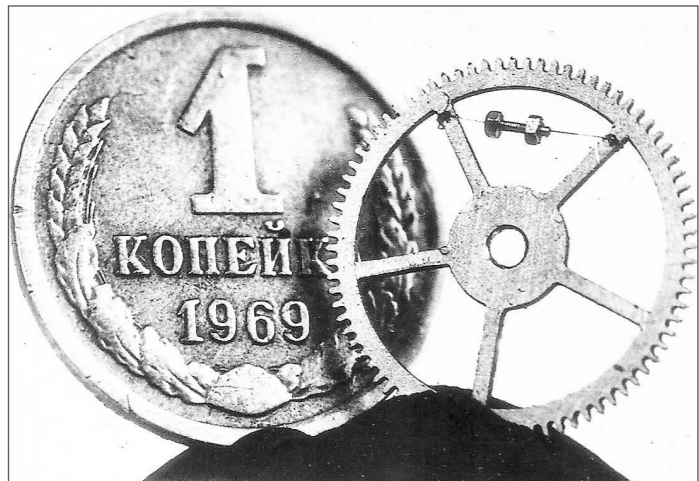
Такие художественные композиции в стиле техно Сысольятин мастерил буквально на коленке — в шестёрнке размером с копеечную монету на невидимой глазу нити висит гайка, накрученная на болтик

Уральские учёные согласились, что очень много бюрократических препон мешает развитию науки. И предложил учёным участвовать в обсуждении реформирования ВАКА. Обнадежил: диссоветы многих вузов и НИИ вскоре получат независимость; исчезнет перечень обязательных изданий для публикации перед защитой; получить степень можно будет по совокупности научных работ.