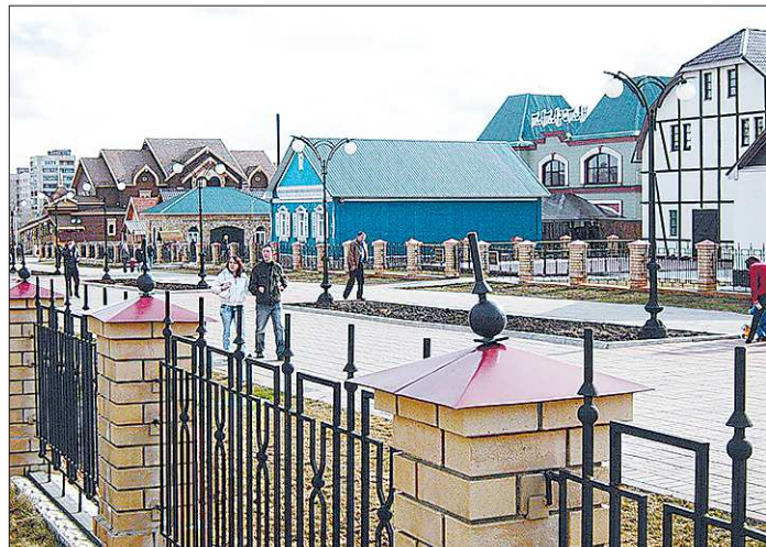
В некоторых городах России подобные национальные деревни уже существуют. Например, эта находится в Оренбурге

ные и сменные музейные экспозиции, ремесленные мастерские, здесь люди должны иметь возможность поговорить на родном языке.