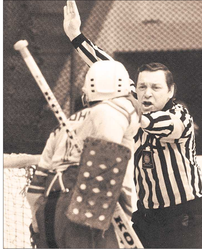
И к игрокам, и к студентам всегда строг, но справедлив

– Что делать. Без теплотехники, которую я преподаю, никуда в металлургии. Но на сегодняшний день заявок на теплотехников почти нет. Основное количество печей в машиностроении, а машиностроение в России рухнуло. Можно закрыть эту специальность как невостребованную, но теплотехника в металлургии, как кастрюля в домашнем хозяйстве. Начнут возрождаться машиностроение, металлургия, а специалисты за один день не подтопишь. Поэтому встречаю своих выпускников в самых разных местах. Что делать, это наша российская действительность.