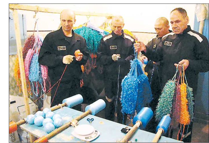
Основное производство в ИК-19 — заготовка и обработка древесины — сейчас испытывает трудности. А «мочалочное» дело процветает