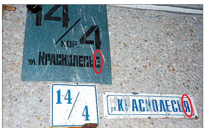
В Екатеринбурге ошибки на вывесках — дело обычное. Одну и ту же улицу могут называть совершенно по-разному

Художники вновь примутся за роспись месяца через два. А закончить украшение храма планируют к концу 2014 года. Вход для прихожан всё это время в верхний придел будет закрыт.