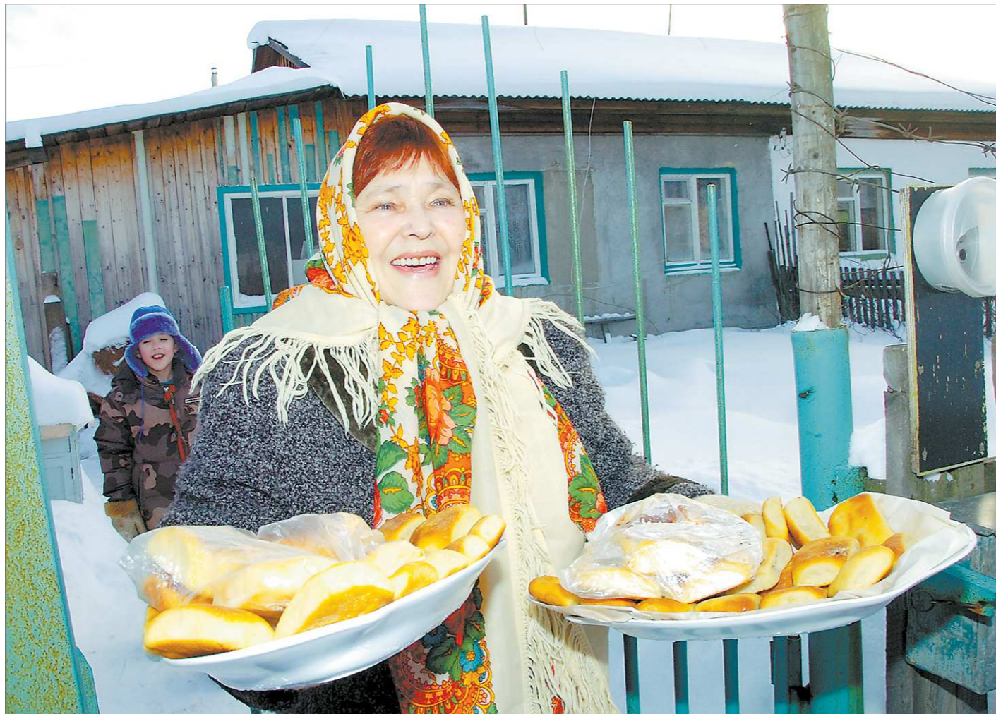
Хлебосольные селяне испокон веков и до сих пор встречают гостей свежей выпечкой. Один из мифов про шанюжку гласит: мучи у северных уральцев было мало, поэтому начинку не заворачивали в тесто, а толстым слоем накладывали сверху лепёшки

– Мы, например, воспринимаем Екатеринбург как