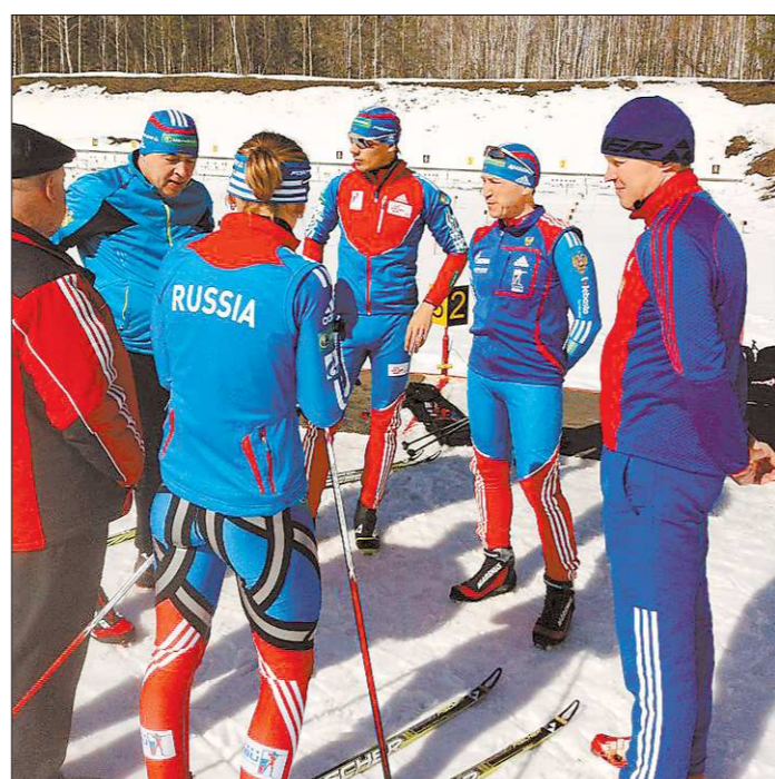
«Совещание» на свежем воздухе