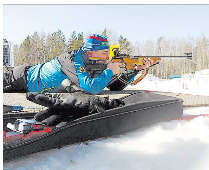
В интервью сайту Rusbiathlon.ru Антон Шипулин отметил, что глава региона находится в хорошей форме: «У него получилось выбить даже 5 из 5 мишеней. С учетом того, что винтовка не была подогнана под него, это очень хорошо»

Губернатор Свердловской области на время переквалифицировался в биатлониста