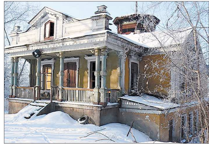
Жители Нижнего Тагила надеются, что новое здание сохранит все черты стиля двухвековой давности

В ООО «Бородулинское» нам сообщили, что все попытки заключить договор о вывозе бочек с лицензированной организацией в регионе пока безуспешны.