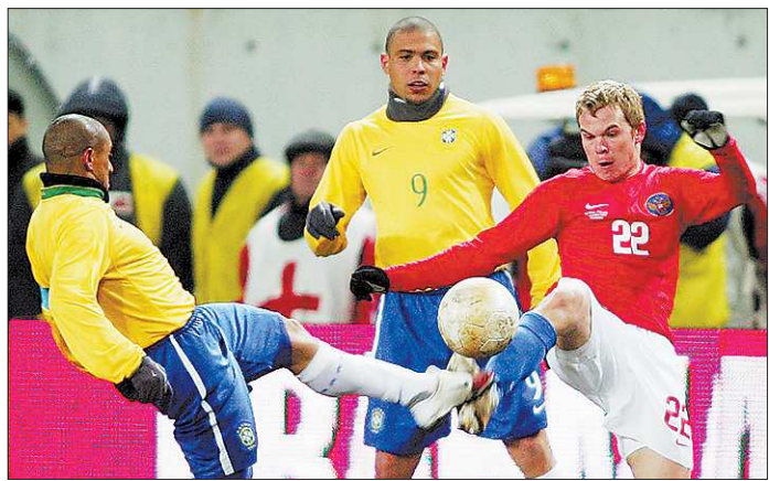
По версии ФАС вместо бразильского пива российские зрители увидели отечественные бренды