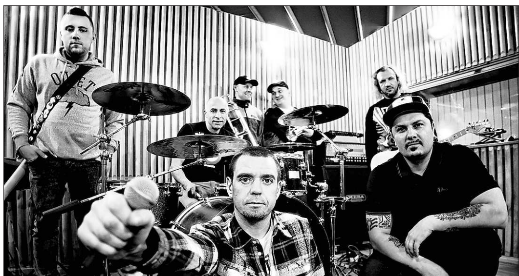
Сергей Михалок и группа «Ляпис Трубецкой» нечасто балуют своими приездами уральских поклонников. В День города лидеры белорусского рока сыграют на Площади 1905 года.