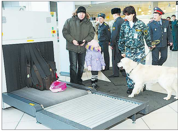
На столичных вокзалах, где ходят «Сапсаны», зоны досмотра уже давно работают. И никаких претензий у пассажиров нет