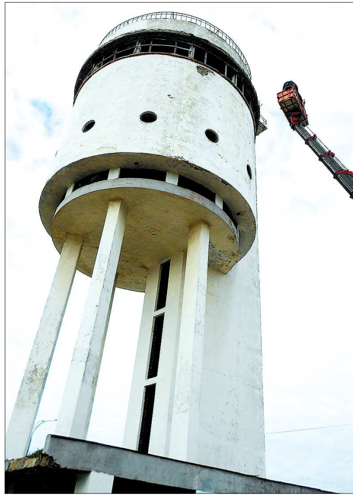
За 82 года существования башни в ней не проводилось ни одной реконструкции

В сентябре прошлого года областное министерство госимущества по заявке общественной организации «Группа архитектурных инициатив, событий и коммуникаций» (арх-группа Podelniki) передало ей Белую башню в безвозмездное пользование. Но не просто так, а выдал группе задание на прове-