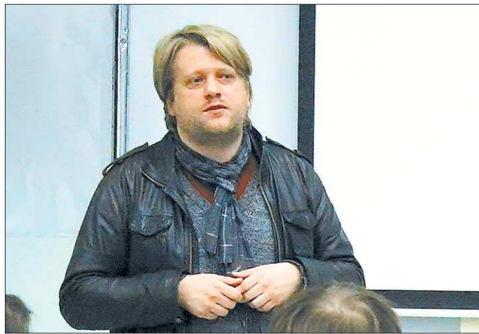
Режиссёр Георг Жено занимается синопсисом и не пытается творить на века