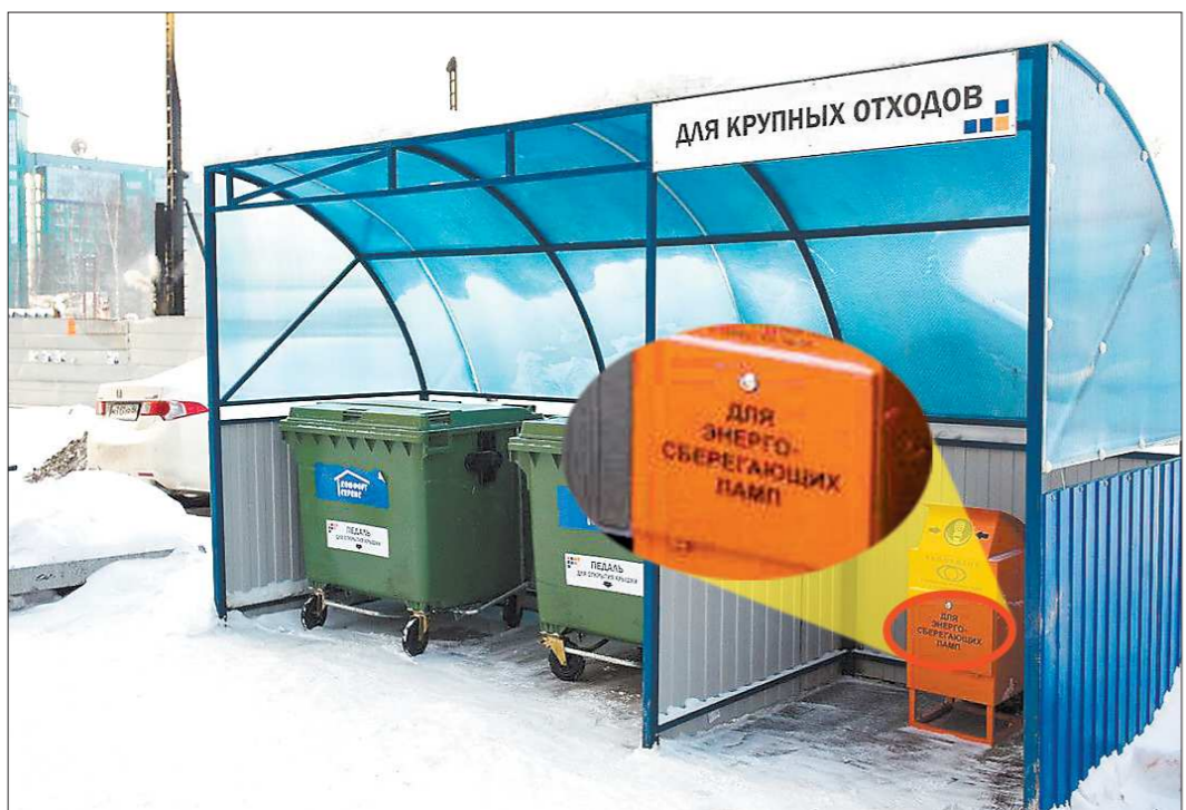
В Сургуте с июля 2012 года плата за хранение и утилизацию ртутных ламп входит в тариф по содержанию жилья - 33 копейки с каждого квадратного метра в месяц

«ОГ» выражает надежду, что и минобразование озобоится наконец вопросом зарплат педагогов, работающих вне системы образования. По примеру минздрава.