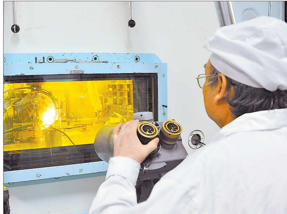
За «окном» метровой толщины происходит ядерная реакция, а свою работу операторы выполняют с помощью манипуляторов

Безусловно, проект весьма амбициозный, и ещё не известно, будет ли он успешным. Работы по созданию ядерных ракетных двигателей велись ещё в 60–70-е годы прошлого века в СССР и США, но в силу ряда причин, в том числе и экологического характера, были остановлены. Но наука на месте не