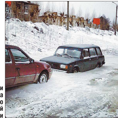
Владельцы оставили свои машины на ночь по незнанию коммунальной обстановки

ГОСУДАРСТВЕННОЕ БЮДЖЕТНОЕ УЧРЕЖДЕНИЕ СВЕРДЛОВСКОЙ ОБЛАСТИ «РЕДАКЦИЯ ГАЗЕТЫ "ОБЛАСТНАЯ ГАЗЕТА"». ОБЩЕСТВЕННО-ПОЛИТИЧЕСКОЕ ИЗДАНИЕ