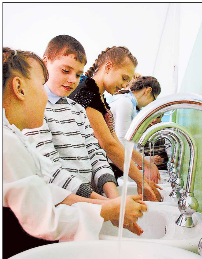
Краснопольская детвора отвыкает от «старорежимных» рукомойников

Общественное движение «Билимбаевцы» насчитывает около тысячи активистов из числа местных жителей (всего в Билимбае — 7 тысяч жителей). Они пытаются решать вопросы не только о том, где хоронить, но и о том, как дальше жить и написали письмо в Управление Роспотребнадзора по Свердловской области с просьбой разобраться в истории с кладбищем. Пока ответа оттуда не последовало.