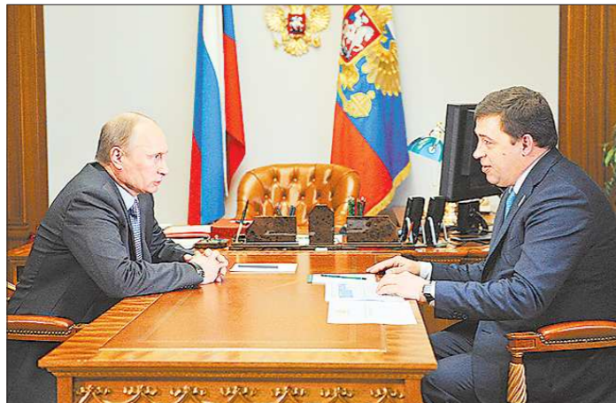
Владимир Путин попросил Евгения Куйвашева рассказать о ситуации в Нижнем Тагиле и других моногородах области