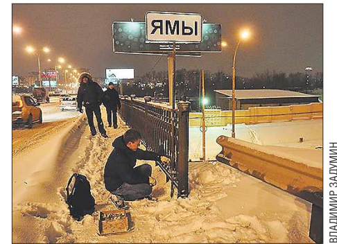
Длина отдельных ям на этой дороге — больше метра, а глубина — до десяти сантиметров