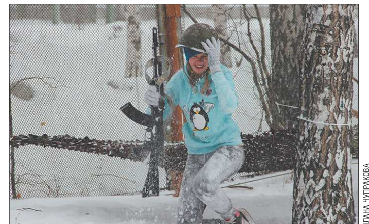
По условиям соревнований, в каждой команде должны быть девушки. Верхнепышминские кадеты этого не учли, за что лишились призового места...