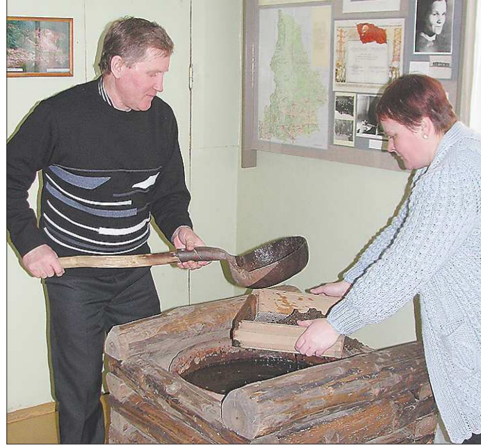
В местном музее вам предложат намать настоящие самоцветы

Привлекать специалистов местные власти намерены не только зарплатой, но и возможностью получить жильё.