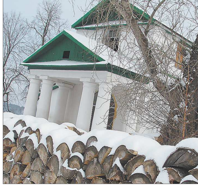
Без дров учреждениям культуры не обойтись и в XXI веке