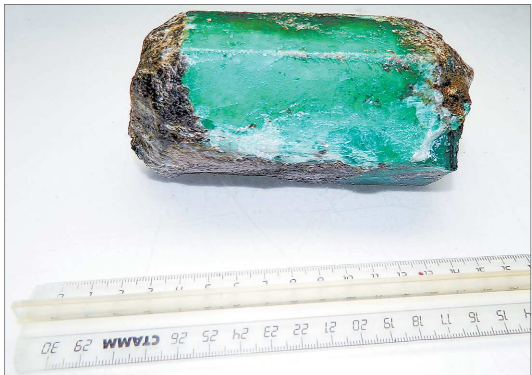
Весит неочищенный кристалл 1011 граммов. В длину он около 12,5 сантиметра, в ширину — 6,5. К слову, это примерно одна шестидесятая часть всей годовой добычи (в 2012 году от месторождения было получено 60 кг 142 г изумрудов)

ство развития регионов. Планируется, что подготовка к выставке драгоценностей должна закончиться к 1 мая (а пройдёт она в доме Севастьянова). По крайней мере, как нам сказал Аркадий Соколов, заместитель директора обособленного подразделения «Малышева», именно вчера руководство получило предложение выставить свои камни на будущей экспозиции. Однако решение пока не принято.