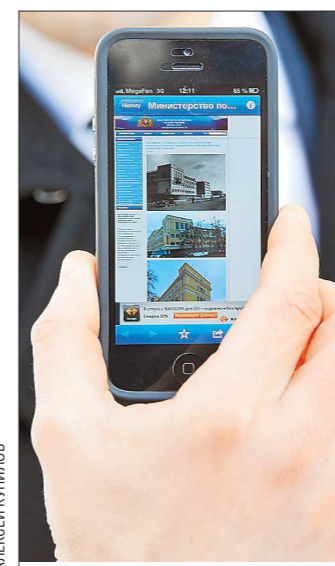
Технология проста: телефон сканирует QR-код и даёт ссылку на сайт МУГИСО. На нём для каждого объекта культурного наследия есть своя веб-страница

Мы планируем установить такие таблички на всех пешеходных маршрутах к июлю этого года, - рассказал замминистра Артём Богачёв. - К октябрю планируем оснастить кодами в общей сложности 400 объектов. При сканировании кода пользова-