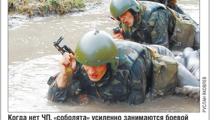
Когда нет ЧП, «собольята» усиленно занимаются боевой подготовкой

20 лет назад (в 1993 году) на базе Тавдинского управления лесных исправительно-трудовых учреждений (УЛИТУ) МВД России был создан отряд специального назначения «Соболь». Задача отряда было немедленное реагирование на осложнение оперативной обстановки в исправительно-трудовых учреждениях (ИТУ) - фактически, усмирение бунтов заключённых. Однако о серьёзных событиях такого рода ничего не известно. С 1995 года началось сокращение лесных колоний и расформирование УЛИТУ. К 1998 году в Пермской, Кировской, Свердловской и Кемеровской областях осталось лишь 122 лесные колонии с общей численностью заключённых 46,6 тысячи человек. Все они из центрального подчинения МВД перешли в ведение ГУФСИН. Уже в составе отдела специального назначения «Россы» ГУФСИН России по Свердловской области Тавдинское отделение (бывший отряд «Соболь») восемь раз выезжало в длительные командировки на Северный Кавказ. Там бойцы-спецназовцы несли службу на блокпостах, охраняли особо важные объекты и вылавливали в горах бандитов. За проявленную доблесть почти весь личный состав бывшего «Соболя» награждён государственными наградами, ведомственными медалями, именным оружием. Сергей АВДЕЕВ, Руслан ЯКОВЛЕВ