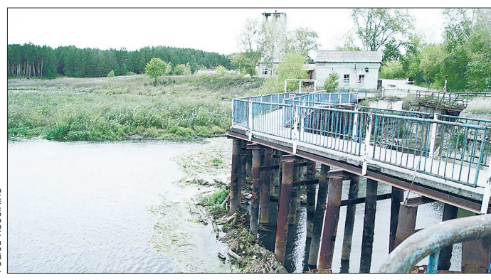
Бобровское водохранилище, обводнённое отложений, не могло послужить альтернативой «сдувшемуся» сельскому водопроводу

В течение трёх недель жители посёлка Бобровского в Сысертском районе вынуждены были жить без воды. Насос мощностью 16 кубометров в час качал из скважины воздух, а коммунальщики твердили: ищем порыв трубы. Как выяснилось, искили не там. Если вообще искили.