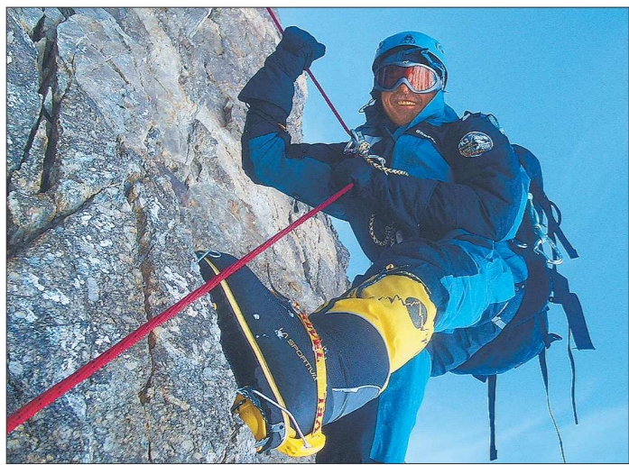
В списке самых опасных вершин мира Эверест занимает десятое место