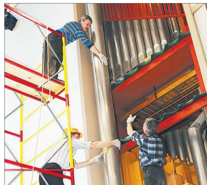
Длина «больных» труб 3-4 метра, вес самой большой – 97 кг