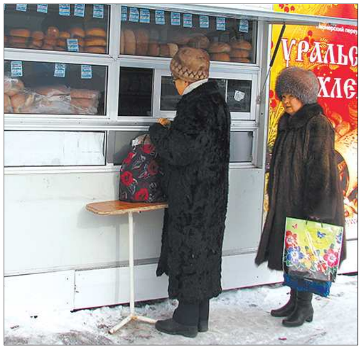
Торговые пункты хоть и не назовёшь полноценными магазинами, но для жителей посёлка – это единственное место для покупок